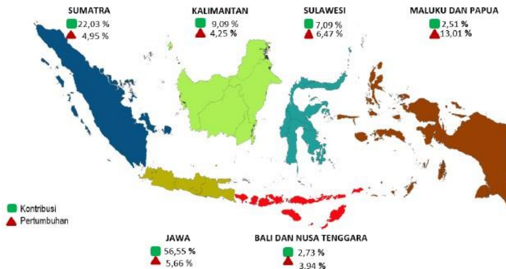
Gambar 1. Pertumbuhan Dan Kontribusi PDRB Menurut Pulau Triwulan II-2022 (Persen)

Kesejahteraan masyarakat yang diukur dari tingginya pendapatan perkapita tergantung dari pertumbuhan ekonomi yang ada di suatu negara tersebut. Untuk mengetahui pertumbuhan ekonomi suatu negara bisa dicermati melalui data PDB. Jika produk domestik bruto suatu daerah memberikan kontribusi yang besar maka hal ini bisa menunjang pendapatan perkapita masyarakat tersebut.