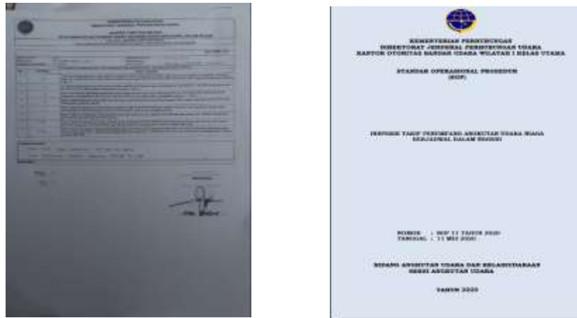
Gambar 2 Checklist Tarif dan SOP Tarif

Dalam hal ini pengawasannya yang berdasarkan pada ketentuan berlaku yaitu Pengawasannya Direktorat Angkutan Udara dan Kantor Otoritas Bandar udara, Laporan dari penyelenggara Bandar Udara, Media Elektronik dan media massa, Laporan masyarakat/pengguna jasa, Harga tercantum didalam tiket, penjualan secara online (elektronik) dan/atau bukti pembayaran lain yang dipersamakan dan Pemberitahuan agen ( agen news ).