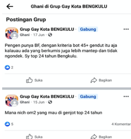
Gambar 1. Grup Facebook Gay Kota Bengkulu.

Pada penelitian awal ini juga peneliti mencoba untuk menganalisis media sosial yang berkaitan dengan aktivitas gay . Pada ruang digital terkhusus media sosial peneliti menemukan fakta bahwa mereka tanpa rasa malu saling berinteraksi secara vulgar dengan menggunakan Second Account media sosial mereka atau akun Alter Ego yang mana akun tersebut sangat berlawanan dengan diri mereka ketika menampilkan diri di akun utama. Akun pertama dibuat sebagai panggung depan untuk mempresentasikan dirinya secara positif dan berjalan sebagaimana kodratnya. Sementara pada Second Account ini mereka dengan sangat bebas menjadi diri mereka sendiri tanpa takut untuk di hakimi dan diketahui oleh keluarga, kerabat atau teman mereka di dunia nyata. Secara vulgar komunitas anggota komunitas gay mencari pasangan sesama jenis bahkan walau hanya untuk mendapatkan kepuasan semata sebagaimana yang terlihat pada gambar screenshot dari grup Facebook dengan anggota lebih dari 1.400 orang sebagai berikut: